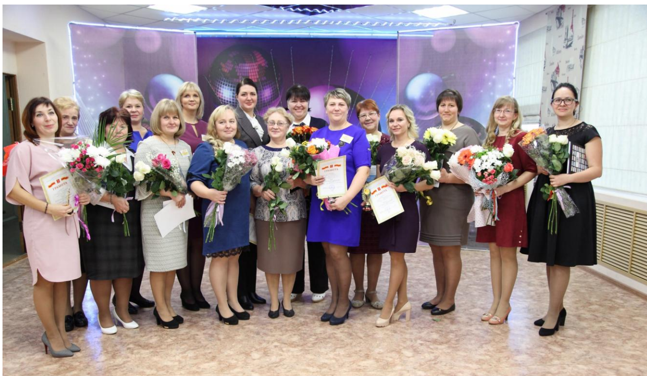
Участники конкурса «Педагог-профессионал - 2019»

Конкурс состоит из трёх этапов: публичной презентации опыта, мастер-классов педагогов, открытой дискуссии.